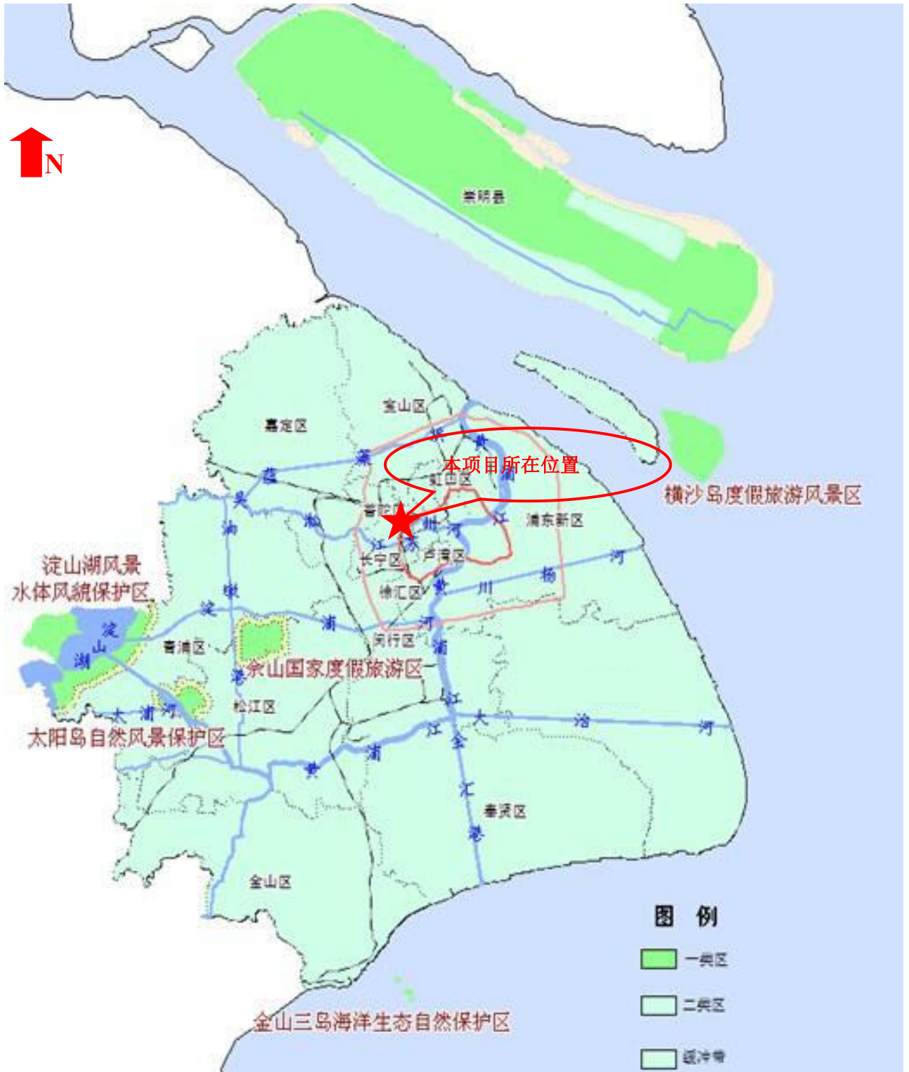
附图10 项目所在大气功能区划图